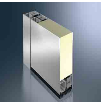
Schüco Tür-System ADS 75.SI Schüco door system ADS 75.SI

Die hochwärmedämmte Tür für hohe Ansprüche an das Energiemanagement in Kombination mit funktionellen Ansprüchen.