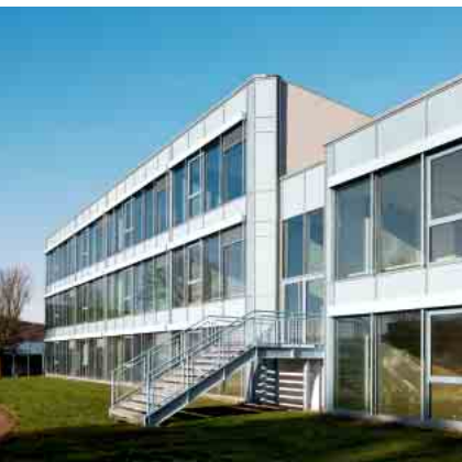
Schüco Aluminium Tür-System ADS 75.SI Schüco Aluminium door system ADS 75.SI

Aluminium Tür-System Aluminium door system